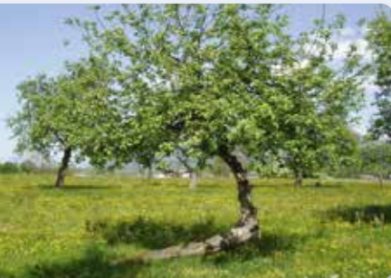
Obstbaum, der vor einer Störzone „flüchtet“