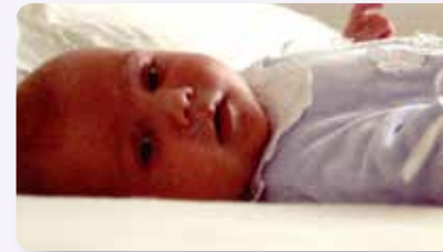
Die Kleinen reagieren oft besonders sensibel

Nach bereits über 9.000 untersuchten Schlaf- und Arbeitsplätzen bringen wir viel Kenntniss und Erfahrung im Umgang mit Störzonen mit. Zahlreiche Rückmeldungen und protokollierte Fälle bestätigen unsere langjährige seriöse Arbeit. Wir präsentieren unsere umfangreichen Tätigkeiten auch gerne auf Vorträgen, Messen etc.